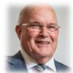
T. Grinwis Secretariaat van de TVG cursus locatie Middelharnis.